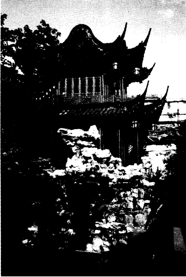
Chinesische Pagode Shanghai

Kontakt zu Freunden und Bekannten und wenn wir unsere Weihnachtspost schreiben, geht diese in viele Länder.